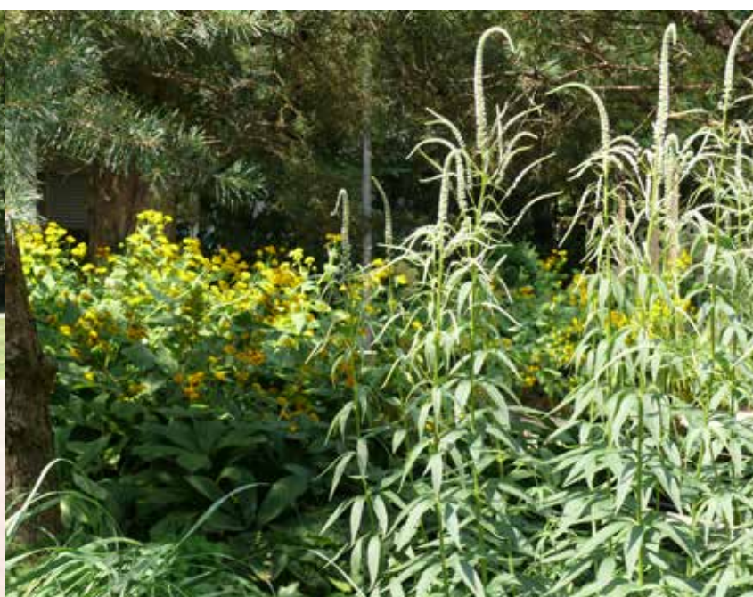
I bedene ses bl.a. gul iris, løvehale, akanthus, hvid fredløs, bronzeblad, tusindstråle billedtekst engelsk