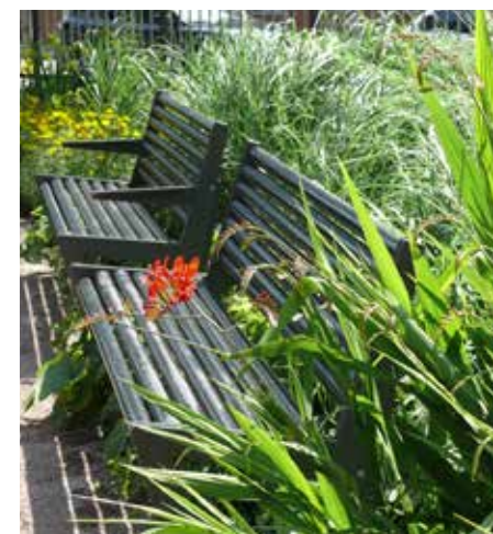
billedtekst billedtekst engelsk