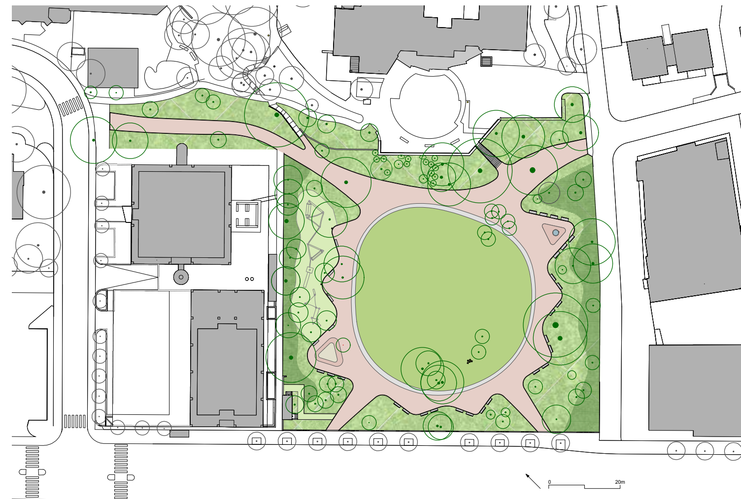
billedtekst billedtekst engelsk