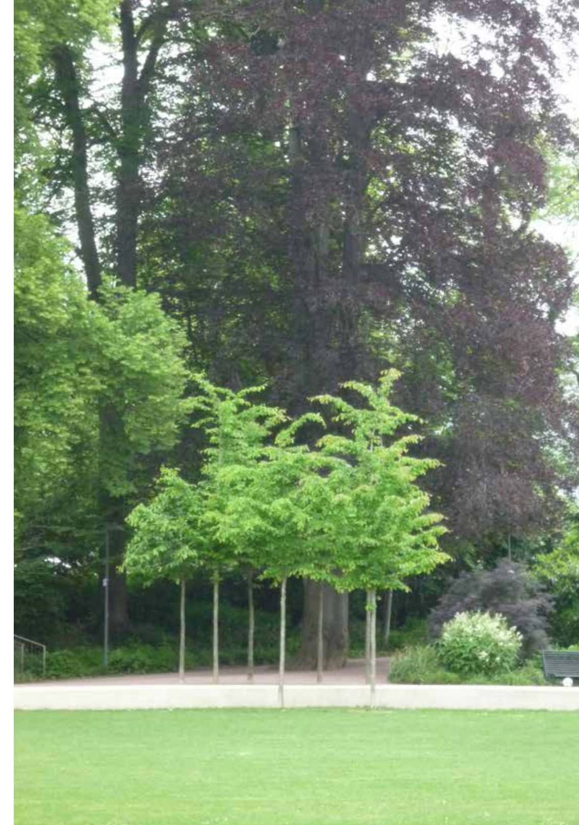
billedtekst, bevaret rødbyg og gruppe med nye bøg? billedtekst engelsk