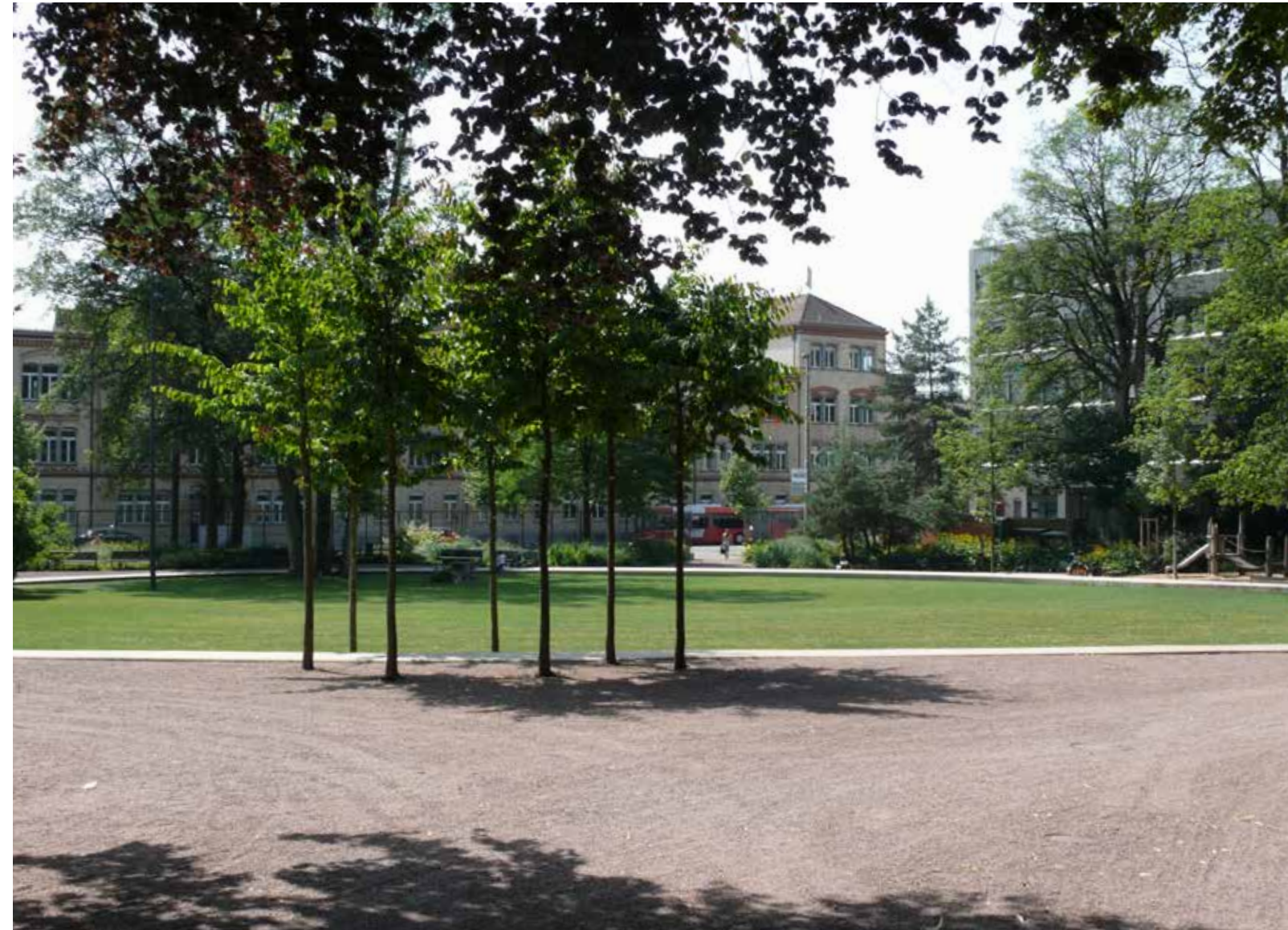
billedtekst billedtekst engelsk

Et hegn i bevægelse langs den befærdede Zürcherstrasse lige over for den nu nedlagte maskinfabrik Sulzer i Winterthur tiltrækker sig opmærksomhed. Lodrette stålstænger bøjede i bløde former lukker og åbner for indsyn. Et 'dansende' hegn; ikke påkørselsskader, men bevidst arrangerede formationer i et gennemgående flow, en fin hilsen til den gamle maskinfabrik på den anden side af gaden. En åben og dog lukket, ret og dog krum væg mod en moderne park, Brühlgutparken.